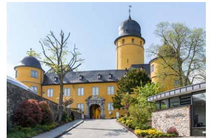
Hotel Schloss Montabaur