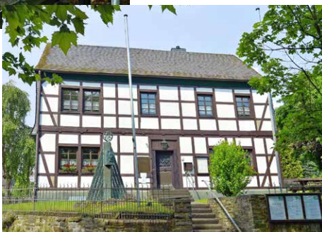
Raiffeisen-Geburtshaus in Hamm an der Sieg.