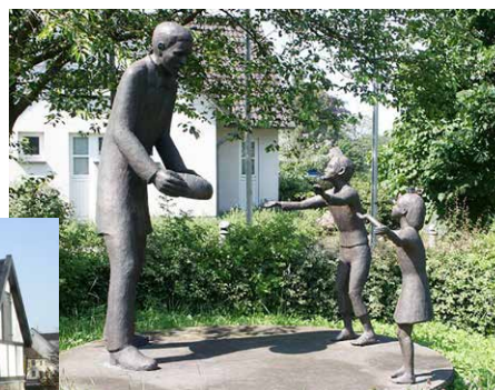
Raiffeisen-Denkmal "150 Jahre Brodverein" in Weyerbusch.