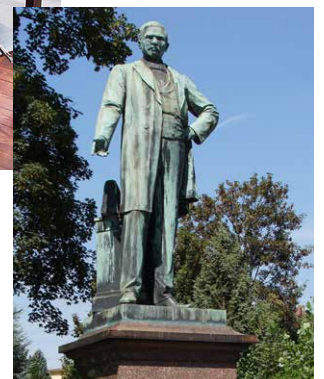
Denkmal für Friedrich Wilhelm Raiffeisen in Neuwied.